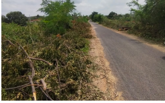
అవగాహన కల్పించాలని వర్ణావరణ ప్రేమికులు కోరుతున్నారు. ఇప్పటికైనా ఉన్నతాధికారులు స్పందించాలని మండల వాసులు కోరుతున్నారు.