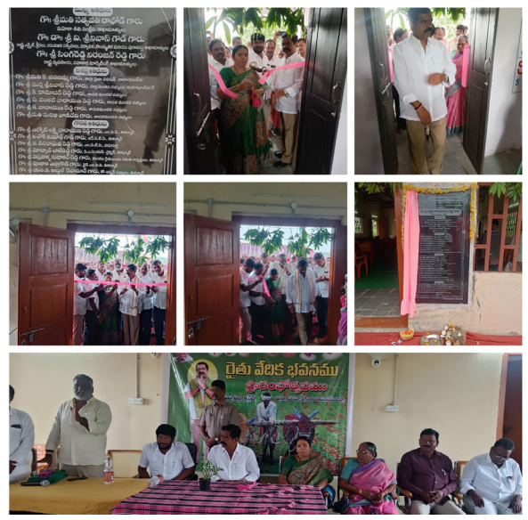
పంటకు కావాల్సిన వసతులు కల్పించాలి అన్నారు.

నారాయణపేట జిల్లా ప్రతినిధి, ఆగస్టు 19 (తీనూర్ న్యూస్): జిల్లా కేంద్రంలోని ఉటూర్ మండలం, లోని నిడుగుర్తి గ్రామంలో ఎమ్మెల్యే పర్వతి, అంగన్ వాడీ భవనం మరియు రైతు వేదిక భవనం ప్రారంభం చేశారు. ఈ కార్యక్రమంలో ఎమ్మెల్యే ప్రసంగ్మా ఈ రాష్ట్ర ముఖ్యమంత్రి రైతు కావున ప్రతి రైతు పదే కష్టాలు అన్నీ చూసాడు కాబట్టి రైతులు ఇబ్బందులు పడుతున్నారని రైతు బంధు, ఉచిత కరెంట్ వంటి పథకాలు అమలు చేయడం వల్ల రైతులు సుఖంగా ఉంటున్నారని రైతులు చెప్పింది పండించిన పంటలను ప్రభుత్వం కొనుగోలు కేంద్రాల ద్వారా సేకరిస్తున్నారని. నియోజక వర్గం లో ఈ రోజు ఉదయం నుంచి ఇప్పటివరకు 100 బీసీ, దళిత బంధు, గౌరెల పంపిణీ చేయడం జరిగిందన్నారు. కేంద్రం నుండి ఒక్క మెడికల్ కాలేజీ కూడా శాంక్షన్ కాలేదు అని మన ముఖ్యమంత్రి వాడి గురించి ఆలోచించడం మానేసి తానే స్వయంగా జిల్లాకు ఒక్కటి చొప్పున 33 జిల్లాలకు 33 కాలేజీలు మంజూరు చేయడం జరిగిందని తెలిపారు. ముఖ్యమంత్రి ఇప్పటి వరకు తన పాలానికి వెళ్లి పంటలు పరిశీలిస్తారు. కావున సమయానికి