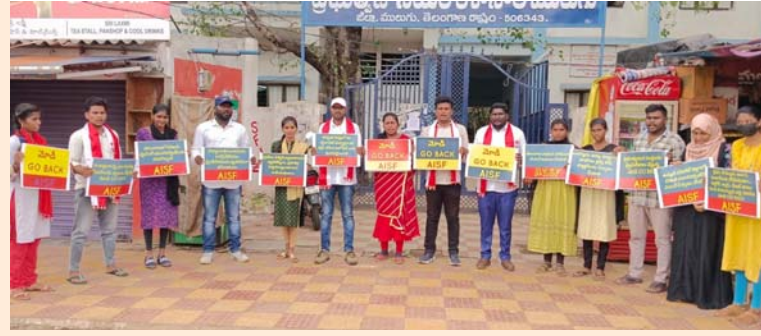
ములుగు, జూలై 07 (తీవ్రా న్యూస్):