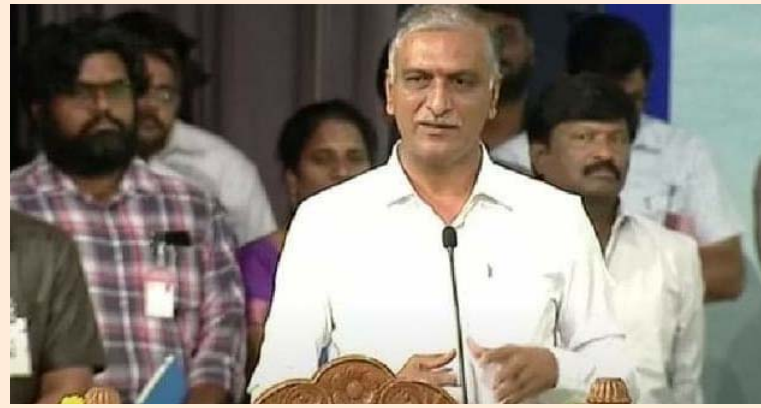
హైదరాబాద్, జూలై 07 (తీవ్రా న్యూస్):

దేశంలో అత్యధికంగా వేతనం తీసుకుంటున్న ఆశా వర్కర్లు తెలంగాణలోనే ఉన్నారని మంత్రి హరీశ్ రావు అన్నారు. ఆశా వర్కర్ల మొత్తం బిల్లులను ప్రభుత్వం భరిస్తున్నదని చెప్పారు. బస్ దవాఖానలతో ప్రజలకు మెరుగైన వైద్య సేవలు అందుతున్నాయని మంత్రి హరీశ్ రావు అన్నారు. హైదరాబాద్ శిల్పకళావేదికలో కొత్తగా ఎంపికైన 15 వేల మంది ఆశావర్కర్లకు మంత్రి తలసాని శ్రీనివాస్ యాదవ్, మహమూద్ అలీతో కలిసి మంత్రి హరీశ్ రావు నియామక పత్రాలు అందేశారు. అనంతరం మాట్లాడుతూ ఒకప్పుడు ఏ రోగం వచ్చినా గాంధీ, ఉస్మానియా దవాఖానలకు వెళ్లేవాళ్లమని స్పష్టం చేశారు ఆ పరిస్థితి లేదన్నారు. సీఎం కేసీఆర్ హైదరాబాద్లో 350 బస్ దవాఖానలు ఏర్పాటు చేశారని వెల్లడించారు. దీంతో ఉస్మానియా, గాంధీ హాస్పిటల్లో ఓపీ శాతం తగ్గించిన దానిని గ్రేటర్ హైదరాబాద్ పరిధిలో మూడు ఎంసీపీఎస్ సూపర్ స్పెషాలిటీ దవాఖానలు ఏర్పాటు చేస్తున్నామని మంత్రి హరీశ్ చెప్పారు. కేసీఆర్ కిట్తో మాతా శిశు మరణాలను తగ్గించామని చెప్పారు. పైసా ఖర్చు లేకుండా టీ-డయాగ్నోస్టిక్లో ఉచితంగా 134 పరీక్షలు చేస్తున్నామని చెప్పారు. తెలంగాణకు అసలైన డాక్టర్ హరీశ్ రావు మంత్రి తలసాని శ్రీనివాస్ యాదవ్ ఆశావర్కర్ల సేవలు మరచిపోలేనివని మంత్రి తలసాని శ్రీనివాస్ యాదవ్ అన్నారు. తెలంగాణలోని ఆరోగ్య సేవలు దేశానికే ఆదర్శమన్నారు. ప్రజలు ప్రభుత్వ దవాఖానలపై మొగ్గు చూపుతున్నారని చెప్పారు. కరోనా సమయంలో ఆశావర్కర్ల సేవలు విశేషమైనవని తెలిపారు. తెలంగాణకు అసలైన డాక్టర్ మంత్రి హరీశ్ రావు అని వెల్లడించారు. రాష్ట్రంలో ఆశా వర్కర్ల రూ.9,750 వేతనం ఇస్తున్నామన్నారు.