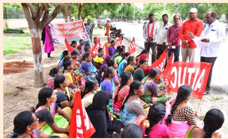
భువనగిరి జిల్లా ప్రతినిధి, జూలై 07(తీవ్రార్ న్యూస్):