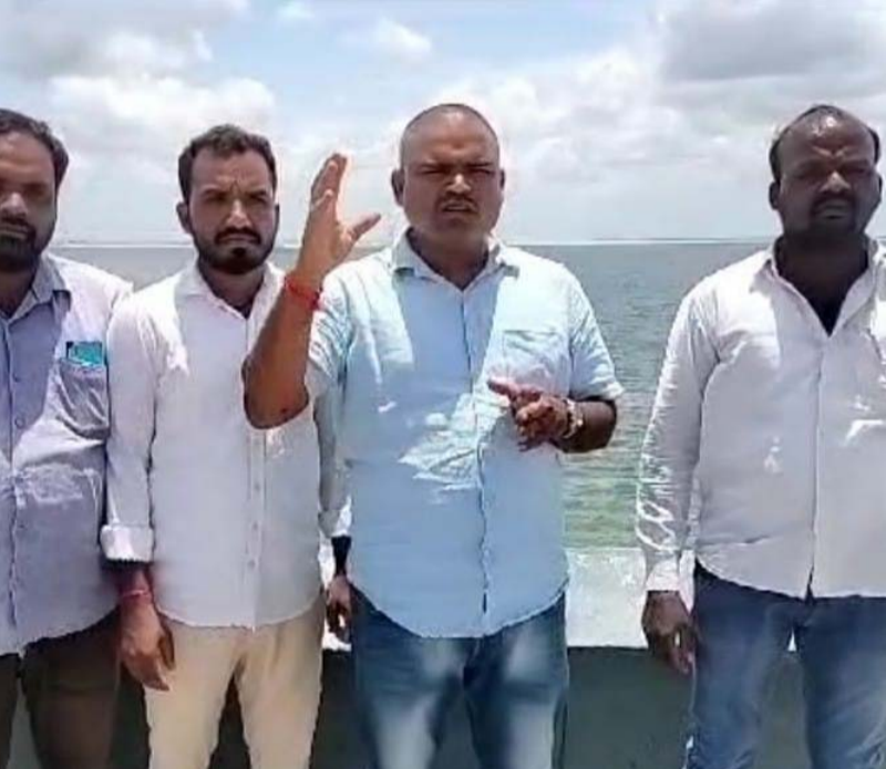
యాదాద్రి ప్రతినిధి, జూలై 17 (తీవ్రా న్యూస్):