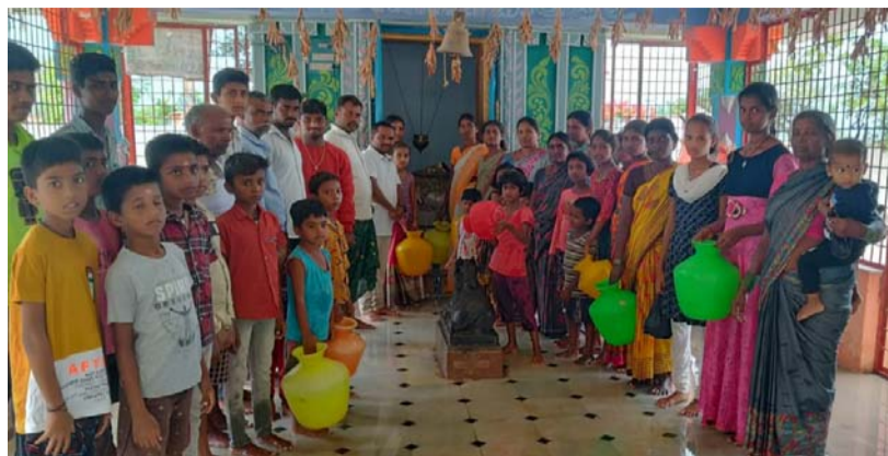
పెద్దేరు, జూలై 17 (తీవ్రా న్యూస్):

పెద్దేరు మండలం పరిధిలోని కొత్త సూగురు గ్రామంలో శ్రీ ఉమారామలింగేశ్వర స్వామి దేవాలయం కమిటీ అధ్యక్షులు తెలంగాణ రాష్ట్రంలో వర్షాల కురిసి వసవల్ని నియోజక వర్గంలో రైతులు సంకోషంగా సాగు చేసుకోవాలని కొత్త సూగురు గ్రామంలో శివాలయం