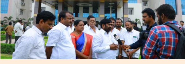
సూర్యాపేట జిల్లా ప్రతినిధి, జూలై 17 (తీవ్రా న్యూస్):

ఈ నెల 24 న ముఖ్యమంత్రి కేసీఆర్ చేతుల మీదుగా ప్రారంభం కానున్న మెడికల్ కళాశాల నూతన భవనం తో పాటు ఎన్ టి పి ప్లాంట్ ను సోమవారం రాష్ట్ర విద్యుత్ శాఖామంత్రి గుంటకండ్ల జగదీష్ రెడ్డి సోమవారం సందర్శించారు. అదే రోజు ప్రారంభించనున్న బిఆర్ఎస్ పార్టీ కార్యాలయంలో జరుగుతున్న పనులను ఆయన పర్యవేక్షించారు. మంత్రి జగదీష్ రెడ్డి వెంట రాజ్యసభ సభ్యులు, బిఆర్ఎస్ పార్టీ జిల్లా అధ్యక్షుడు బడుగుల లింగయ్య యాదవ్, తదితరులు పాల్గొన్నారు.