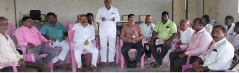
దేవరకర్ల ప్రతినిధి, జూలై 17 (తీవ్రార్ న్యూస్):