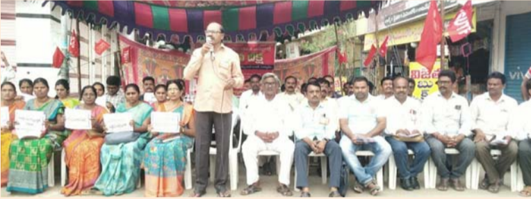
సూర్యాపేట టౌన్, జూలై 17 (తీవ్రార్ న్యూస్):