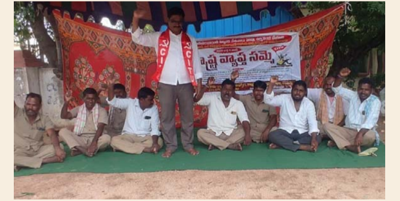
మఖల్, జూలై 17 (తీవ్రార్ న్యూస్):