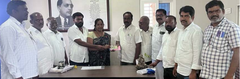
పెట్టేరు, జూలై 17 (తీవ్రార్ న్యూస్):