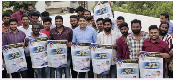
హనుమకొండ, జూన్ 08 (తీర్థార్ న్యూస్):