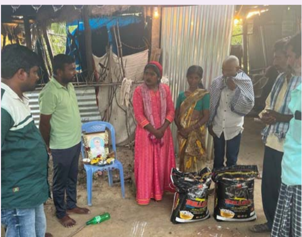
వెంకటాపూర్, జూన్ 08 (తీవ్రా న్యూస్):

● సర్పర్ చారిటబుల్ ట్రస్టు ఆధ్వర్యంలో సాయం