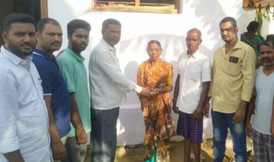
రాజుపేట, జూన్ 08(తీవ్రార్ న్యూస్):