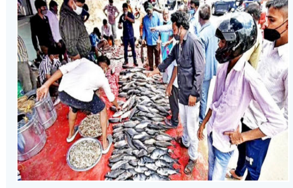
మృగశిర కార్తె తెలంగాణలో ఒక ప్రత్యేకతను కలిగి ఉంది. ప్రతి సంవత్సరం మృగశిర కార్తె సమయంలో తెలంగాణలో చేపలు తినడం ఆనవాయితీగా వస్తున్నది. సాధారణ రోజులతో పోల్చుకుంటే ఈ రోజు అత్యంత ఎక్కువ మొత్తంలో చాపల అమ్మకాలు.. కొనుగోళ్లు జరుగుతుంటాయి. చేపలు ఏంలో మంది వారి ఆహార అలవాట్లలో సర్వసాధారణంగా తినేదే అయినా.. మృగశిర కార్తె రోజు తప్పక తినాలనేది పెద్దల నుండి వస్తున్న సాంప్రదాయం. ఇక ఈ రోజు అందరికంటే ఎక్కువగా ముదిరాజులకు.. మత్స్యకారులకు అత్యంత పవిత్రమైన రోజుగా భావిస్తారు. మిగతా 2లో..