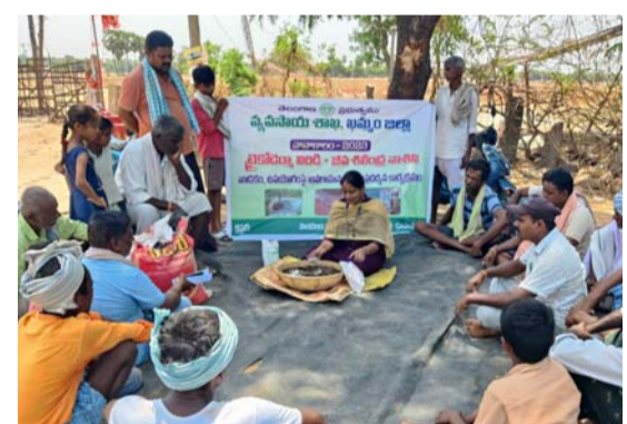
కూసుమంచి, జూన్ 08 (తీర్థార్ న్యూస్):

కూసుమంచి మండలంలోని కిష్టాపురం, లాల్ సింగ్ తండా గ్రామాల్లో రైతులకు ముందస్తు వరి సాగు ట్రైకోడెర్మా విరిడి ప్రదర్శనను వ్యవసాయ అధికారిని ఏవో రామదుగు వాణి వ్యవసాయ క్షేత్రంలో నిర్వహించడం జరిగింది. ఈ సందర్భంగా రైతులకు అవగాహన కల్పించారు. రైతులు దీర్ఘకాలిక రకాలను జూన్ 10 లోగా, మధ్య కాలిక రకాలను జూన్ 15లోగా, స్వల్పకాలిక రకాలను జూన్ 25 లోగా వారు పోసుకోవాలని ఈ విధంగా వేరుదరు వల్ల అక్టోబర్ మూడో వారం నుండి నవంబర్ మొదటి వారంలోగా పరిశీలన పూర్తి చేసుకోవచ్చని తద్వారా యాసంగి పంటను కూడా ముందుకు