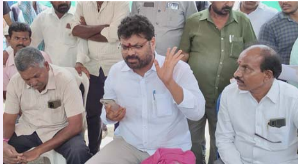
ములుగు, జూన్ 08 (తీవ్రా న్యూస్):