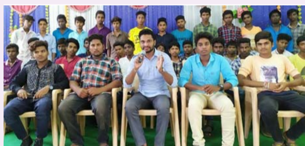
మంచిర్యాల జిల్లా ప్రతినిధి, జూన్ 08(తీవ్రార్ న్యూస్):