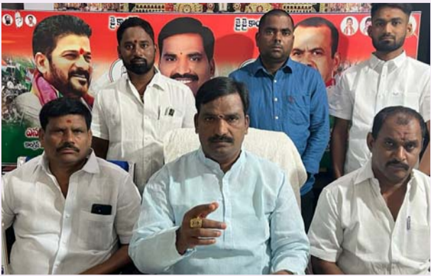
యాదగిరిగుట్ట, జూన్ 08 (తీవ్రా న్యూస్):