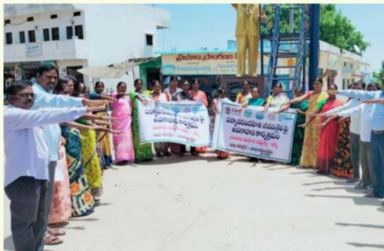
మజ్జర, జూన్ 05 (తీవ్రా న్యూస్):

ప్రపంచ పర్యావరణ దినోత్సవాన్ని పురస్కరించుకొని నర్స మండలంలోని ఆధ్వర్యంలో ర్యాళీ నిర్వహించి మానవహారం చేపట్టారు. అనంతరం మాట్లాడుతూ ఈ సందర్భంగా ఐక్య రాజ్య సమితి టీటీ ప్లాస్టిక్ ప్లాస్టిక్ నిషేధిద్దాం అనే నందేశంతో ప్రపంచ వ్యాప్తంగా అవగాహన కలిగిస్తున్న కార్యక్రమాల్లో భాగంగా సమాజాన్ని చైతన్యం చేసేందుకు అవగాహన కలిగిస్తున్నట్లు తెలిపారు. జీవజాతుల మనుగడకు తీవ్ర విఘాతం కలిగిస్తున్న సింగిల్ యూస్ ప్లాస్టిక్ వలన కలిగే పలు నష్టాల గురించి తెలిపారు. ప్లాస్టిక్ వ్యర్థాలను మూగజీవాలు తిని మృత్యువాత పడుతున్నాయని, కాల్చి వెలువడే విష వాయువులతో ఓజోన్ పొర కు నష్టం కలిగి తద్వారా అనేక క్యాన్సర్ వ్యాధులు కారణం అవుతుందన్నారు. రోడ్లపై వేస్తే నాశ్యుల్లో చిక్కుకొని దోమల ద్వారా విష జ్వరాలు వస్తాయని అన్నారు.