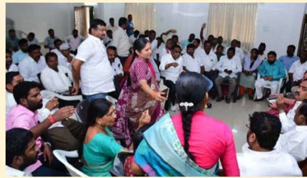
ములుగు, జూన్ 05 (తీవ్రా న్యూస్):