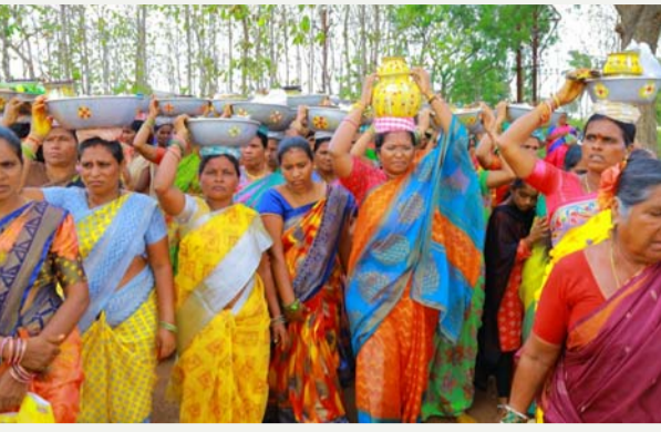
ములుగు, జూన్ 29 (తీర్మాన న్యూస్):