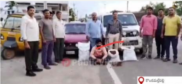
దేవరకొండ, జూన్ 29 (తీర్మాన న్యూస్):

దేవరకొండ నియోజకవర్గం, కొండమల్లేపల్లి మండలంలోని పేరుపల్లి స్టేజీ సమీపంలో హైదరాబాద్ నాగార్జునసాగర్ జాతీయ రహదారిపై భారీగా నల్ల బెల్లం పట్టిక పట్టివేత, ఏర్పాట్ల శాఖ ఆధ్వర్యంలో తనిఖీలు నిర్వహిస్తుండగా రెండు కార్లు అనుమానాస్పద రీతిలో ప్రయాణిస్తుండటంతో వాటిని ఆపి తనిఖీ చేయగా అందులో 15 క్వింటాళ్ల నల్ల బెల్లం 160 కిలోల పట్టిక పట్టుబడింది. పట్టుబడిన నలుగురు వ్యక్తులను అరెస్ట్ చేశారు. స్వాధీనం చేసుకున్న బెల్లంలని మరింత రెండు కార్లను దేవరకొండ ఎక్స్ట్రా స్టేషన్కు తరలెస్తున్నట్లు దేవరకొండ ఎక్స్ట్రా సీబి వెంకటేశ్వర్లు తెలిపారు.