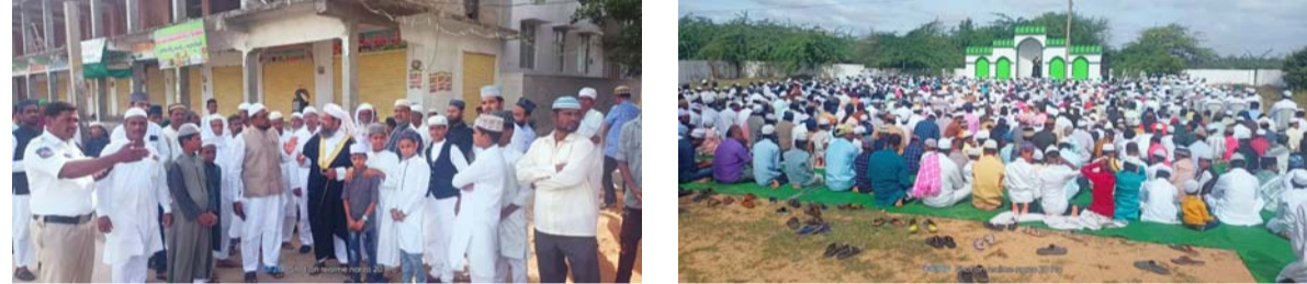
పెద్దేరు, జూన్ 29 (తీర్మాన న్యూస్):