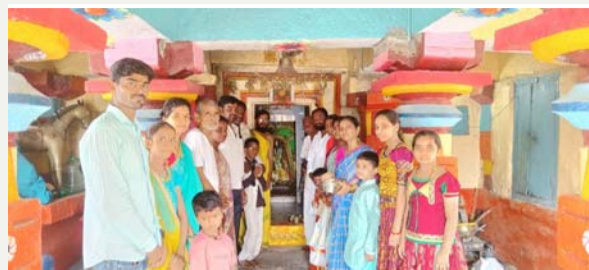
రామన్నపేట, జూన్ 29(తీవ్రార్ న్యూస్):