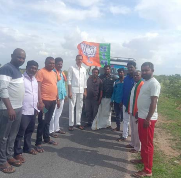
మక్తల్, జూన్ 29 (తీర్మాన న్యూస్):