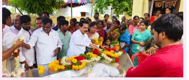
దేవరకొండ, జూన్ 29 (తీర్మాన న్యూస్):