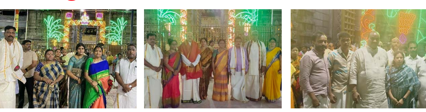
తిరుచానూరు, జూన్ 29(తీర్థార్థ న్యూస్):