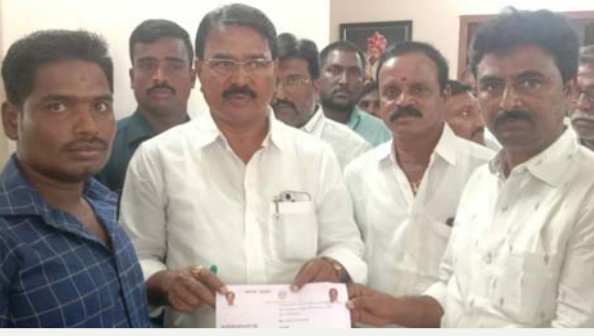
పెళ్లూరు, జూన్ 22(తీర్మాన న్యూస్):

● వ్యవసాయ శాఖ మంత్రి సింగిరెడ్డి నిరంజన్ రెడ్డి