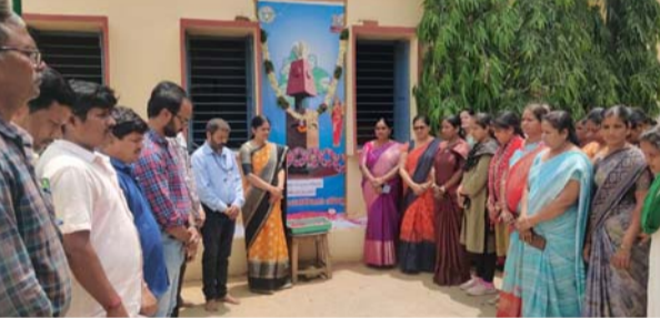
యాచారం, జూన్ 22(తీర్మాన న్యూస్):