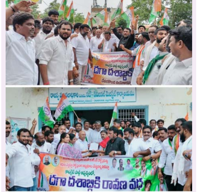
దేవరకొండ, జూన్ 22(తీర్మాన న్యూస్):