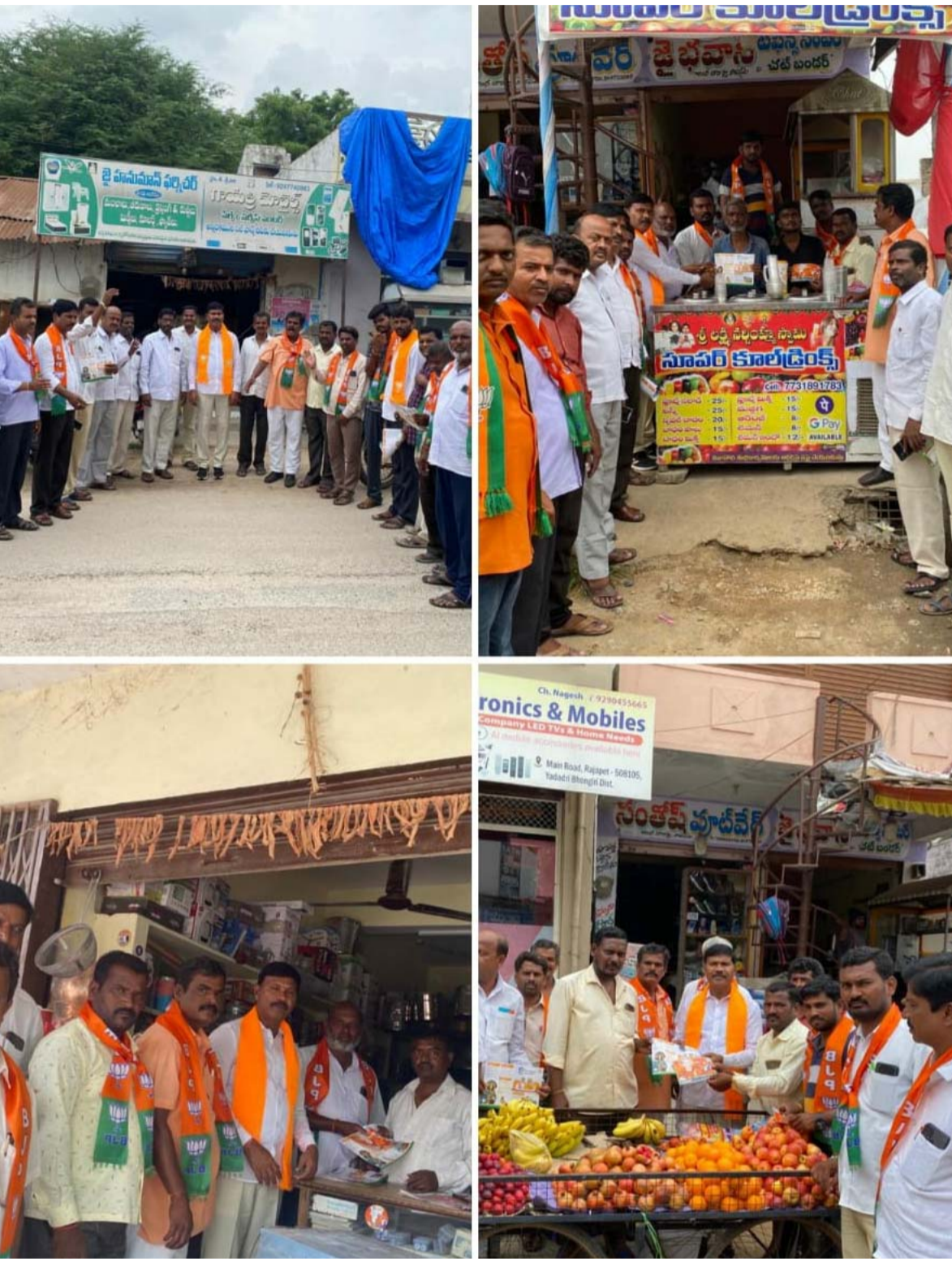
రాజాపేట, జూన్ 22(తీన్కార్ న్యూస్):