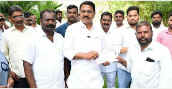
పెళ్లూరు, జూన్ 22(తీర్మాన న్యూస్):