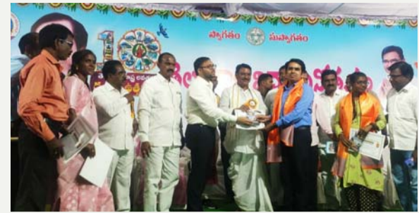
వనపర్తి జిల్లా ప్రతినిధి, జూన్ 21(తీవ్రత న్యూస్):