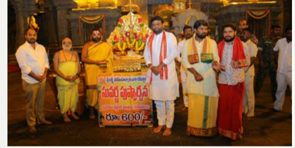
యాదాద్రి, జూన్ 21(తీవ్రత న్యూస్):