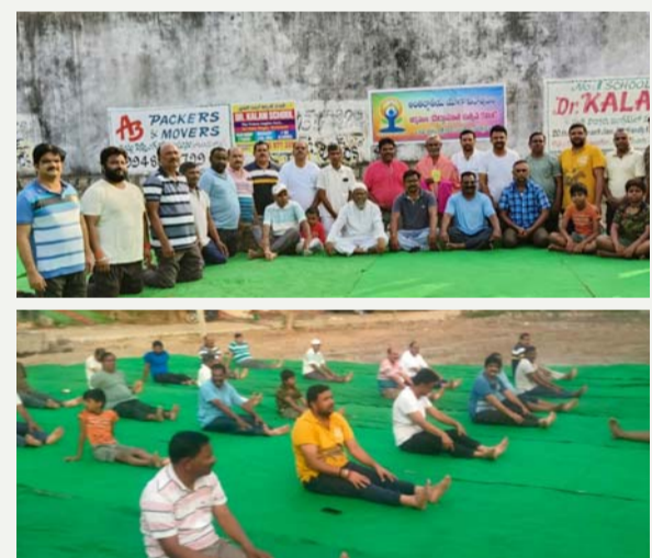
సూర్యాపేట టౌన్, జూన్ 21(తీవ్రత న్యూస్):