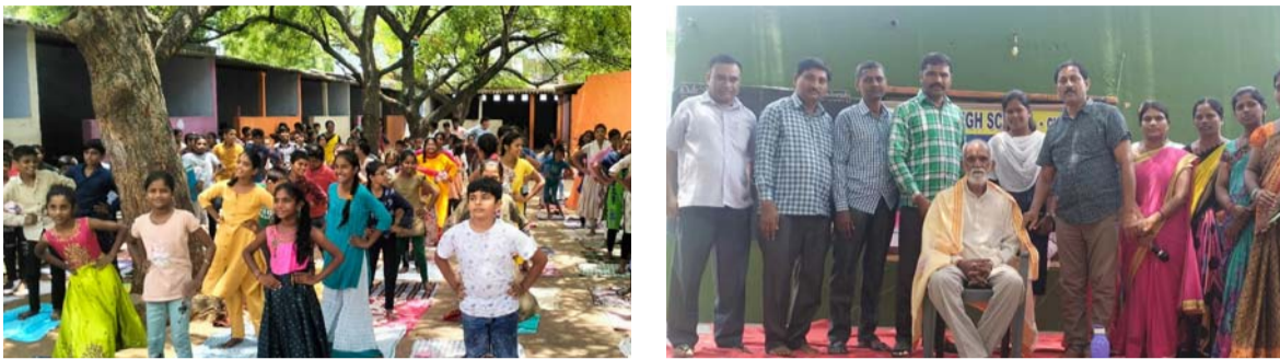
నల్లగొండ జిల్లా ప్రతినిధి, జూన్ 21 (తీన్వార్ న్యూస్):