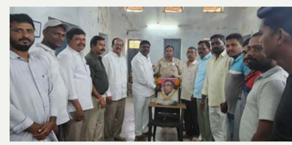
సూర్యాపేట టౌన్, జూన్ 21(తీవ్రత న్యూస్):