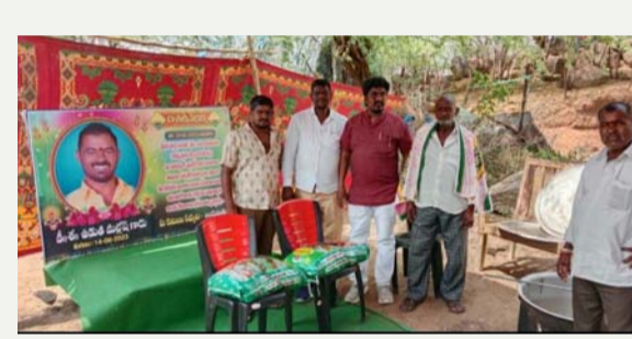
భువనగిరి టౌన్, జూన్ 21(తీవ్రత న్యూస్):