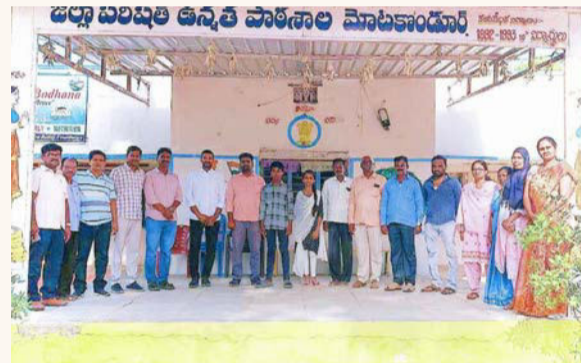
మోటా కొండూరి, జూన్ 16(తీర్మాన్ న్యూస్):