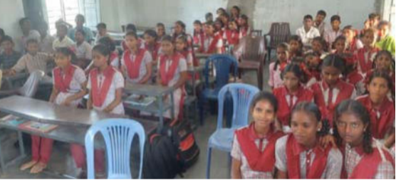
పెట్టేరు, జూన్ 16(తీవ్రా న్యూస్):

పెట్టేరు మండలం, కంచెరావుపల్లి గ్రామంలోని జిల్లా పరిషత్ ఉన్నత పాఠశాలలో విద్యార్థిని విద్యార్థులకు తూనికలు కొలతల శాఖ ఆధ్వర్యంలో అవగాహన కార్యక్రమం నిర్వహించినట్లు జిల్లా తూనికలు కొలతల శాఖ అధికారి సత్యనారాయణ ఒక ప్రకటనలో తెలిపారు. ఏదీని వస్తువు కొనుగోలు చేసినప్పుడు దాని తూకం సరిగా ఉందా లేదా అన్న విషయాన్ని పరిశీలించాలన్నారు. ఎలక్ట్రానిక్ కాంటాలో అయితే సంవత్సరానికి ఒకసారి, ఇతర కాంటాలో అయితే రెండు సంవత్సరాలకు ఒకసారి తూనికలు