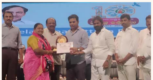
సూర్యాపేట టౌన్, జూన్ 16(తీవ్రార్ న్యూస్):