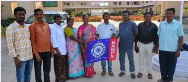
వనపర్తి జిల్లా ప్రతినిధి, జూన్ 16(తీవ్రా న్యూస్):