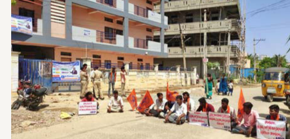
మక్తల్, జూన్ 16 (తీర్థాగ్రామ న్యూస్):