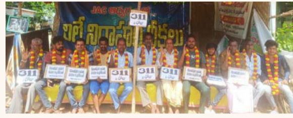
రాజవీట, జూన్ 16(తీర్మాన్ న్యూస్):