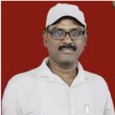
వనపర్తి జిల్లా ప్రతినిధి, జూన్ 16(తీవ్రా న్యూస్):

తెలంగాణ రాష్ట్ర ప్రభుత్వం ప్రతిష్టా తృకంగా చేపట్టిన తెలంగాణ రాష్ట్ర అవతరణ దశాబ్ది ఉత్సవాల కార్యక్రమం లో రాష్ట్రవ్యాప్తంగా నేడు తలపెట్టిన పట్టణ ప్రగతి దినోత్సవంలో భాగంగా సపాయి అన్న - సలాం అన్న అంటూ పాలిశుద్ధ కార్మికులపై రాష్ట్ర ప్రభుత్వం సవతి తల్లి ప్రేమ సదీస్తా ఉంది, రెక్కాడతే గాని దోక్కాడని పరిశుద్ధ కార్మికులు నిత్యజీవితంలో వారి ఆరోగ్యాలను ఫణంగాపెట్టి మోరీలు, మురికి కుప్పలను శుభ్రంచేస్తూ ప్రజల ఆరోగ్యాలను రక్షించడంలో ఎలాంటి అతిశయోక్తి లేదు, వీరే కనుక రెండు మూడు రోజులు విధులకు హాజరు కాకపోతే పట్టణ ప్రగతి కాదు కదా కలరా, మసూబీ, మలేరియా వంటి రోగాలతో గతర తగిలిపోతుంది మన పట్టణం, ఇంతటి సాహసోపేతమైన వృత్తిలో కొనసాగుతున్న చాలీచాలని జీతాలతో ఆర్థికంగా, ఆరోగ్యంగా, మానసికంగా కుమిలిపోతున్నారు. ఏసీలో కూర్చుండే ఉద్యోగులకు లక్షల జీతాలు, మురికి కుప్పలతో పోరాడుతున్న కార్మికులకు చాలీచాలని జీతాలు ఇది ముమ్మాటికీ శ్రమ దోపిడీ, నిజంగా ప్రభుత్వానికి చిత్తకర్షి ఉంటే రాష్ట్రవ్యాప్తంగా పనిచేస్తున్న పాలిశుద్ధ కార్మికులందరికీ 50 వేల రూపాయల జీతం ఇస్తూ వారిని రెగ్యులరైజ్ చేసి అనిపిల్లో క్యాబినెట్ ఆమోదంతో పట్ట సవరణ చేసి జీవో అమలు చేయాలి అని అన్నారు.