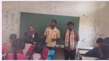
హన్మకొండ, జూన్ 16 (తీర్థాగ్రామ న్యూస్):