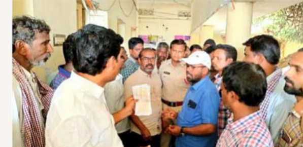
కూసుమంచి, జూన్ 16 (తీర్థాగ్రామ న్యూస్):

కూసుమంచి మండల కేంద్రంలోని తహశీల్దార్ కార్యాలయంలో పనిచేస్తున్న ఇద్దరు ఉద్యోగులు కొట్లాటకు దిగారు. ఇరువురు మధ్య తోపులాట చోటు చేసుకోవడంతో కార్యాలయానికి వచ్చిన ప్రజలు ఆశ్చర్యపోవడం వారి వంతు అయింది. గౌడవ గురించి తెలియడంతో వెంటనే ఎంపీపీ భానోత్ శ్రీనివాస్ నాయక్, ఎస్ఐ రమేష్ కుమార్ కార్యాలయాన్ని సందర్శించారు. గౌడవకు గల కారణాలు వాకవి చేసిన అనంతరం ఇద్దరిలో ఒక ఉద్యోగిని స్థానిక పోలీస్ స్టేషన్ కు తీసుకెళ్లారు. గౌడవకు గల కారణం కుల, ఆదాయ ధ్రువీకరణ పత్రాల జారీ సమయంలో డబ్బులు పనులు చేస్తున్నట్లు ఆరోపణలు వచ్చాయి. గౌడవకు గల కారణం కూడా అదే అనుమానం వ్యక్తం అవుతుంది. పూర్తి వివరాలు తెలియాల్సి వుంది.