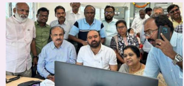
వనపర్తి జిల్లా ప్రతినిధి, జూన్ 16(తీవ్రా న్యూస్):