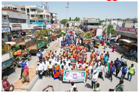
వనపర్తి జిల్లా ప్రతినిధి, జూన్ 16 (తీర్మాన్ న్యూస్):